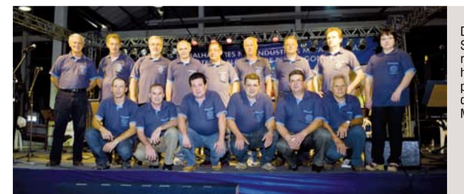
Diretoria do STIMMME recebeu homenagem pelo sucesso da 13ª Festa Metalúrgica