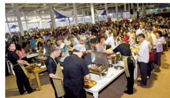
Almoço servido para mais de 3,5 mil pessoas pelo Buffet Dalla Costa reuniu sabor nos pratos e agilidade no serviço