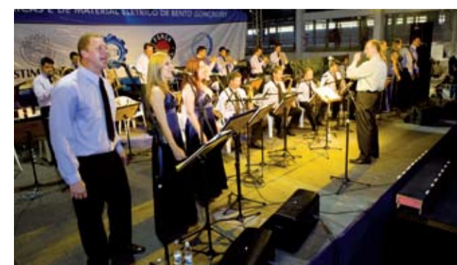
Orquestra Municipal de Teutônia foi atração musical da festa