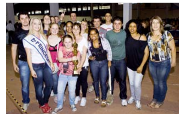
Torcida da Lupatech foi eleita como destaque pelos jurados e levou para casa o troféu