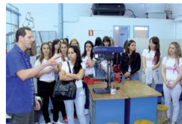
Candidatas visitaram o Centro Profissionalizante mantido pelo Sindicato (Cepromec-BG), e conheceram as opções de cursos