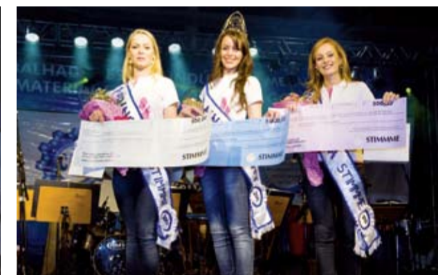
Soberanas receberam premiação do Sindicato: uma caderneta de poupança com R$ 1000 para a rainha e R$ 500 para cada princesa