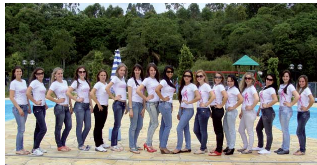
Na Sede Campestre, as meninas puderam relaxar curtindo a paisagem natural