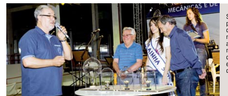
Sorteio de prêmios foi destaque na festa: automóvel, motos e mais de R$ 20 mil em utilidades domésticas