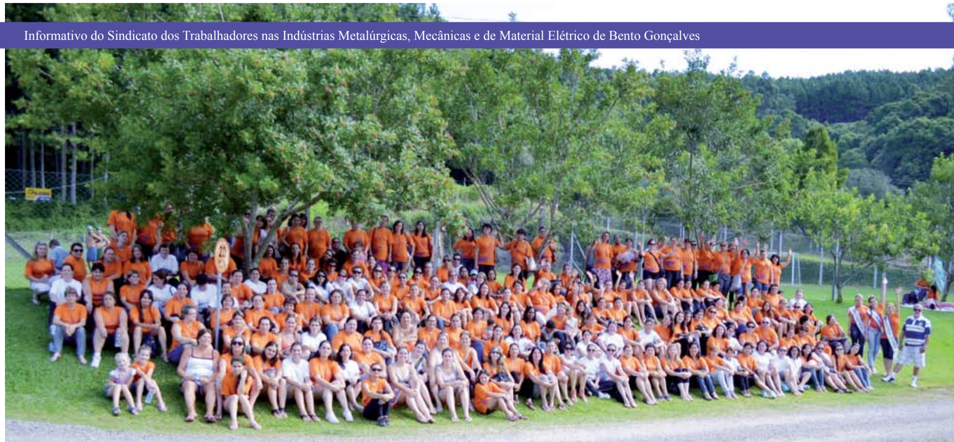
Dia Internacional da Mulher