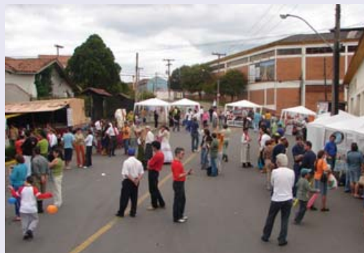
Apresentações de música e dança valorizaram a cultura gaúcha na mateada promovida pelo Stimmme e Abastecedora Décio