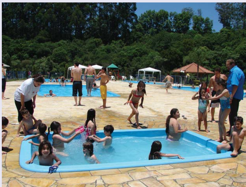
Temporada de veraneio 2007/2008 registrou a presença de mais de 5,2 mil pessoas na Sede Campestre até o fim de fevereiro

É em meio a belas paisagens naturais e amparados por uma infraestrutura repleta de conforto que os trabalhadores das indústrias metalúrgicas, mecânicas e de material elétrico de Bento Gonçalves e região estão aproveitando os dias de verão.