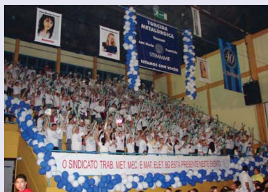
Metalúrgicos receberam troféu de Maior Torcida na escolha da Rainha da Indústria e Comércio do Rio Grande do Sul 2007

Sindicato mobilizou cerca de 500 trabalhadores