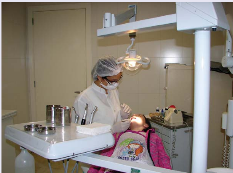
Bom atendimento, qualificação dos profissionais e estrutura do consultório estão entre os pontos positivos destacados por quem já aproveitou a facilidade