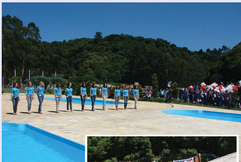
Escolha das soberanas do Stimmme marcou a abertura da Sede Campestre para a temporada de verão 2007/2008. Turma da Ferrari Válvulas, empresa da Rainha eleita, arrebatau troféu como Melhor Torcida