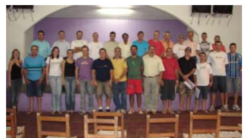
Em Guaporé, representante da categoria marcaram presença