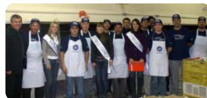
O sucesso da 10ª Festa Metalúrgica deve-se, em grande parte, ao trabalho dos assadores que garantiram o almoço dos convidados