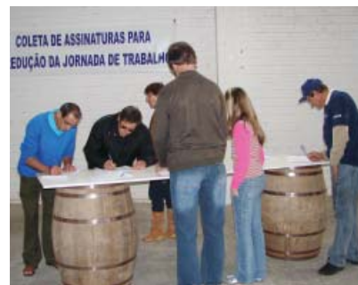
Festa Metalúrgica teve espaço para coleta de assinaturas a favor da redução na jornada de trabalho

“Essa é uma luta muito importante, por isso convocamos toda a categoria a participar da mobilização”, diz.