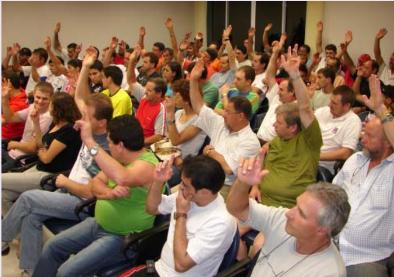
Trabalhadores associados ao Stimmme marcaram presença nas convenções coletivas para negociar reajuste salarial. Em Bento Gonçalves, também acompanharam prestação de contas da entidade

O Stimmme fechou o caixa de 2007 de forma positiva e fez questão de apresentar os bons resultados para seus associados, a exemplo do que faz todos os anos. A apresentação dos números ocorreu na sede da entidade, em Bento Gonçalves, durante assembleia realizada dia 20 de março. O encontro também teve a divulgação da previsão orçamentária para 2008 e marcou o início das negociações para o reajuste salarial anual.