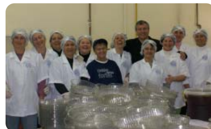
Equipe da cozinha enfrentou verdadeira maratona para abastecer o pessoal responsável por servir as mesas e garantir a qualidade do serviço na Festa