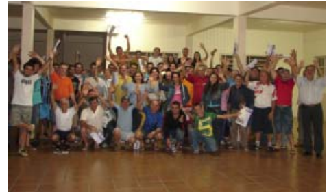
Trabalhadores participaram do encontro em Veranópolis

Em busca do acordo mais justo e que traga mais benefícios para os trabalhadores, o Stimmme vem conduzindo as negociações para o reajuste salarial de 2008.