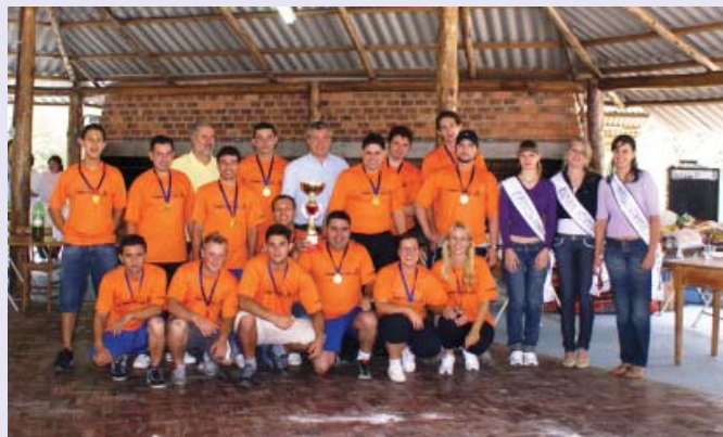
Equipe da Rodotécnica comemorou vitória na Gincana do Dia do Metalúrgico

Entre as equipes inscritas, a grande vencedora foi a Rodotécnica, de Bento Gonçalves. O grupo ergueu o troféu de campeão ao conquistar a maior pontuação nas provas de sorte, de resistência e de conhecimentos gerais sobre a entidade. Os integrantes também receberam um vale-compras para promover uma festa em comemoração à vitória. Também participaram da Gincana as empresas Bertolini, Farina, Ferrari Válvulas, Lumifluor, Obispa Design e Sulmaq. A programação encerrou com um almoço de confraternização oferecido pelo Sindicato aos participantes da Gincana.