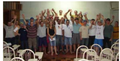
Subsede de Nova Bassano também reuniu associados em Assembleia

Cerca de 200 pessoas participaram das assembleias, reforçando a conscientização dos associados sobre a necessidade de acompanhar as negociações que vão garantir seus direitos, segundo o presidente. "O envolvimento do trabalhador associado nessas atividades é importante porque mostra a força e a união da categoria. Isso ajuda a entidade a conquistar benefícios para todos", afirma. Os encontros também permitiram ao Sindicato comemorar a Páscoa com os associados. O Stimmme sorteou vale compras entre os participantes em cada um dos quatro encontros realizados.