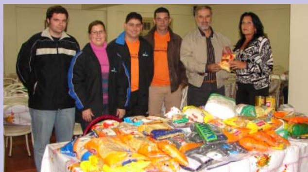
Doação de alimentos arrecadados na Gincana foi feita ao Lar da Caridade

Diversão, integração e solidariedade estiveram lado a lado na proposta da Gincana do Stimmme. A contribuição de cada participante inscrito se transformou nos mais de cem quilos de mantimentos repassados ao Lar da Caridade na noite de 16 de abril. A equipe da Rodotécnica, vencedora da gincana, escolheu a entidade para receber a doação dos alimentos.