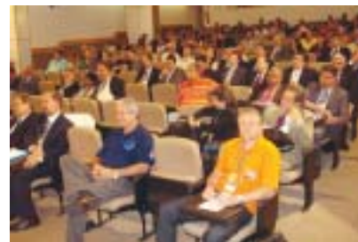
Sindicato acompanhou debates durante o encontro

Atento às novidades e discussões que podem se traduzir em benefícios para a categoria, o Stimmme marcou presença no 2º Encontro Nacional de Advogados, promovido pela CNTM nos dias 20 e 21 de agosto, em Brasília. A programação teve palestras sobre temas como a legitimidade dos Sindicatos para atuar ajuizando ações civis públicas, atuando como substituto processual; Súmula vinculante do STF e a posição do TST com relação ao Adicional de Insalubridade e a redução da jornada de trabalho para 40 horas semanais sem redução salarial.