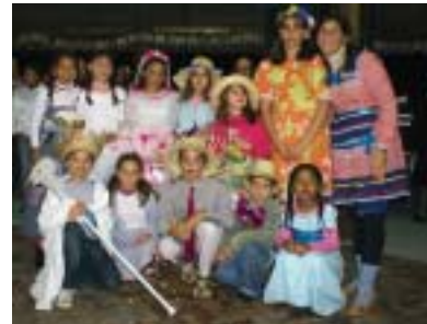
Casamento Caipira foi protagonizado por grupo infantil