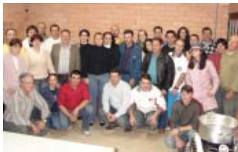
Encontro valorizou dedicação daqueles que contribuíram para realização da festa

O encontro, na noite de 14 de agosto, na Sede Campestre da entidade, reuniu mais de 50 pessoas que ajudaram na organização do arraial. O convite para o momento de integração foi a forma que o Sindicato encontrou para retribuir o comprometimento daqueles que se dedicaram em prol da festa.