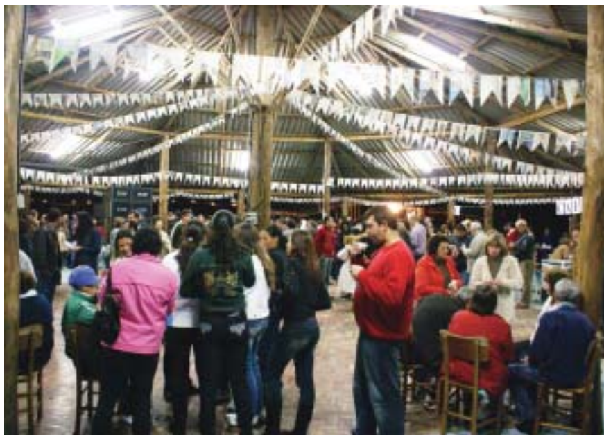
Festa Julhina divertiu convidados com programação que teve fogueira, brincadeiras e muita comida típica

Os pequenos também tiveram espaço reservado na Festa Julhina do Stimmme: pela primeira vez a encenação do casamento caipira ficou a cargo de um grupo de crianças que esbanjou desenvoltura perante o público.